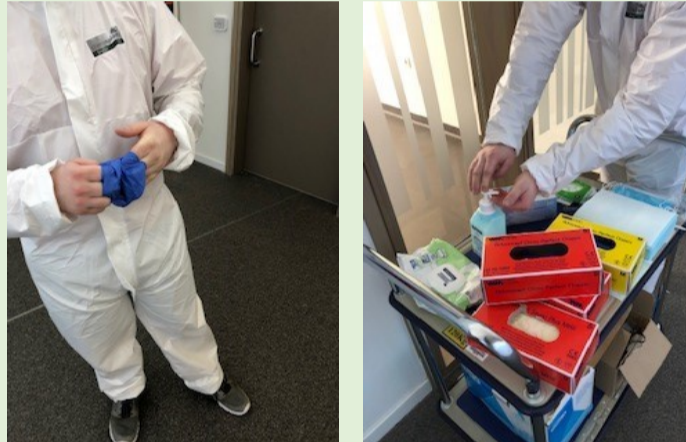
STAP 3: Beschermkledij uitdoen, buitenkant NIET aanraken & aan de voorziene kapstok hangen