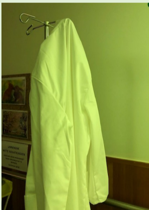
STAP 4: Hang de schort met de buitenzijde langs buiten aan de kapstok