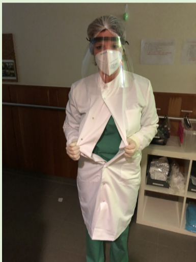
STAP 1: Isolatiejas openen langs de buitenkant