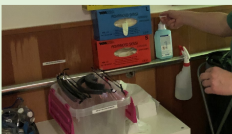
STAP 7: Handontsmetting toepassen