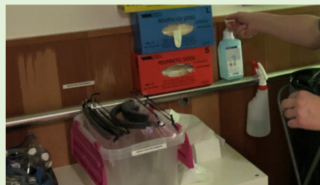
STAP 5: Handontsmetting toepassen